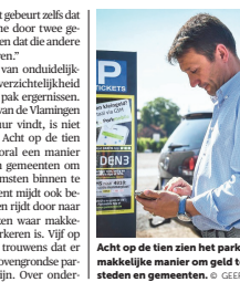
Acht op de tien zien het parkeerbeleid als een makkelijker manier om geld te verdienen voor steden en gemeenten.

We ergeren ons dood aan parkeerzones, parkeertickets en parkeerboetes. Bij Touring vinden daarvoor vorig jaar liefst 20 procent meer klachten binnen. Er is dringende nood aan een eindegebied, klinkt het. 1.845 parkeerklachten kreeg Touring vorig jaar binnen. Opmerkingen en verzuchtingen nemen elk jaar toe. Niet verwonderlijk, vinden ze bij Touring. "Het parkeerbeleid lijkt één grote wanorde", zegt Danny Smaghe. "In de ene gemeente kost parkeren zoveel, in de andere is dat meer of minder. In de ene blauwe zone mag je twee uur parkeren, in de