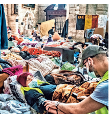
Mensen zonder papieren verwenen in de Begijnhofkerk in Brussel.